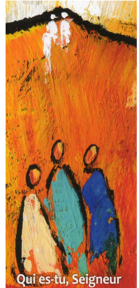
Qui es-tu, Seigneur

Pour rejoindre La Fraternité des capucins