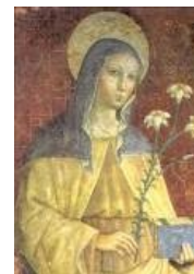
Sainte Claire d'Assise