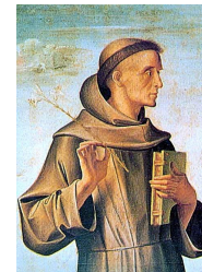
Saint Antoine de Padoue