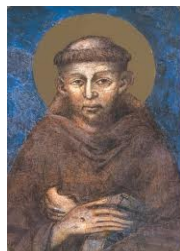
Saint François d'Assise